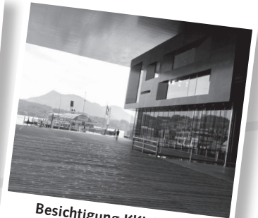
Besichtigung KKL Luzern Donnerstag, 11. Januar 2024