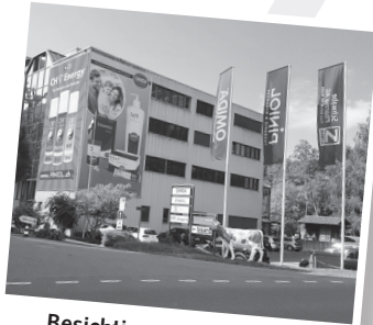
Besichtigung OMIDA AG Dienstag, 20. Februar 2024