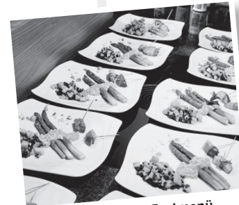
Sommerliches Festmenü Seewen, Dienstag, 11. Juni 2024