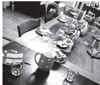
Zmorgenspaziergang April 2024