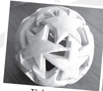
Töpfer-Atelier Samstag, 21. Oktober 2023