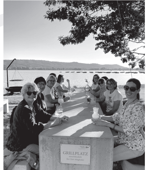
Der Vorstand auf einem Ausflug nach Radolfzell