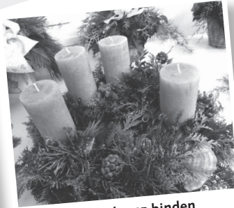
Adventskranz binden Freitag, 24. November 2023