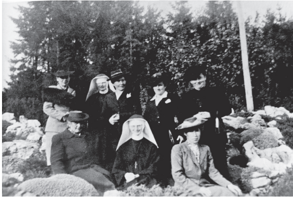
Der Vorstand bei einem Besuch in Menzingen